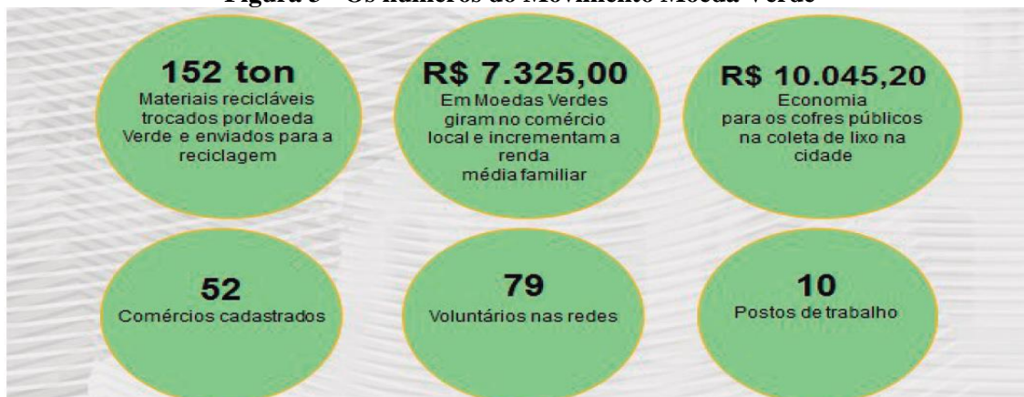
Figura 3 - Os números do Movimento Moeda Verde

Fonte Adaptado de relatório mensal de movimentação da CVRIga (2020).