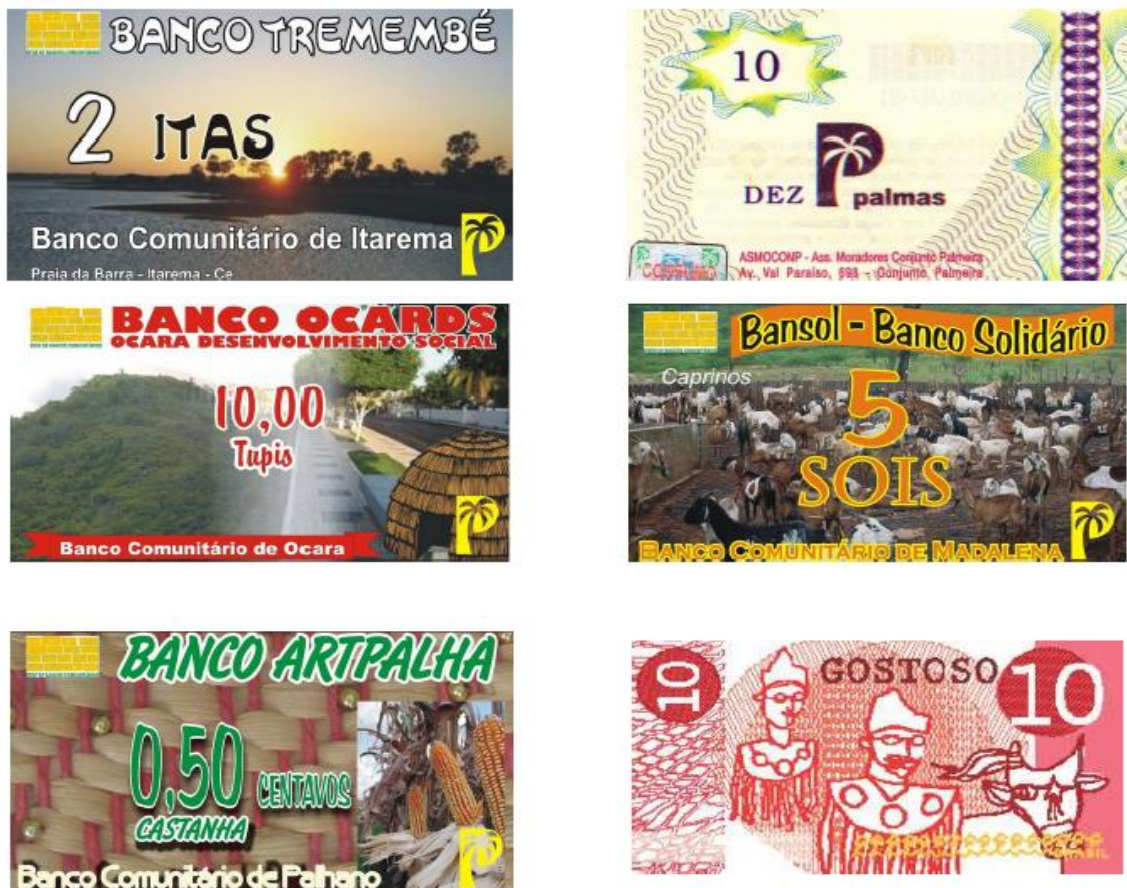
Figura 5 - Moedas sociais existentes no Brasil