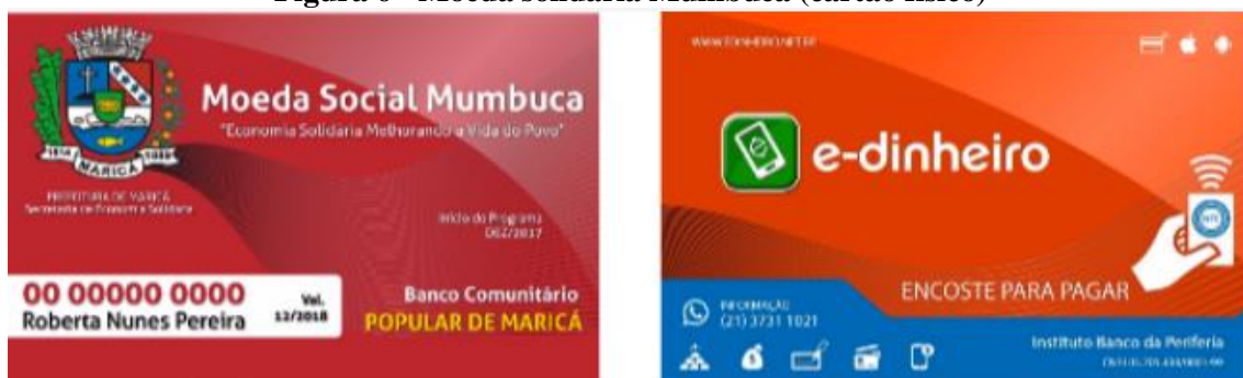
Figura 6 - Moeda solidaria Mumbuca (cartão físico)

atividades ligadas à educação financeira e inclusão social, oferecidos pela prefeitura e pelo banco comunitário.