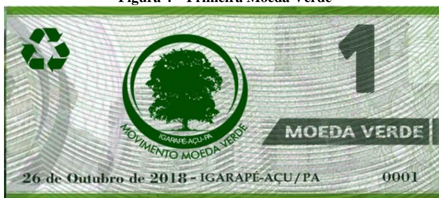
Figura 4 – Primeira Moeda Verde

As principais contribuições do estudo referem-se aos estímulos dos laços de solidariedade, confiança e reciprocidade com legitimação e aceitação social por diversas categorias dos atores econômicos locais e pela sociedade em geral, mitigando a injeção de recursos na economia local ao aumento da utilização da moeda social no território estudado.